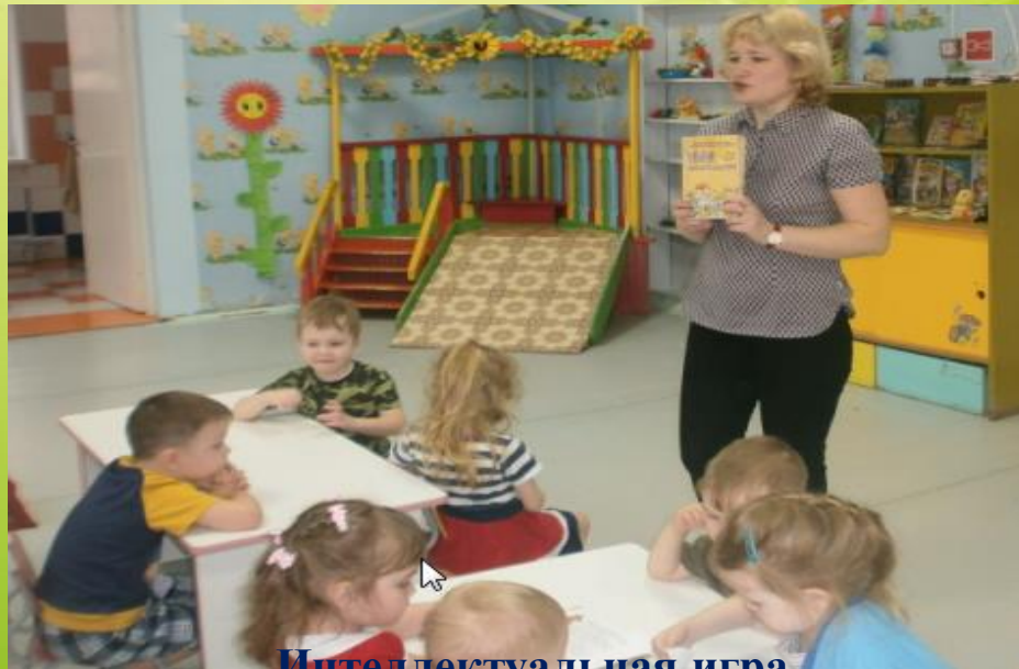
Интеллектуальная игра «Загадки от Светофорыча»