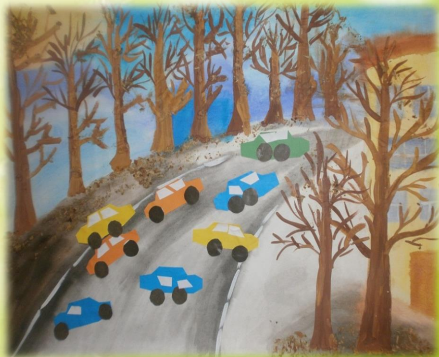
ООД Аппликация «Легковой автомобиль»

Легковой автомобиль По дороге мчится. А за ним густая пыль Тучею клубится.