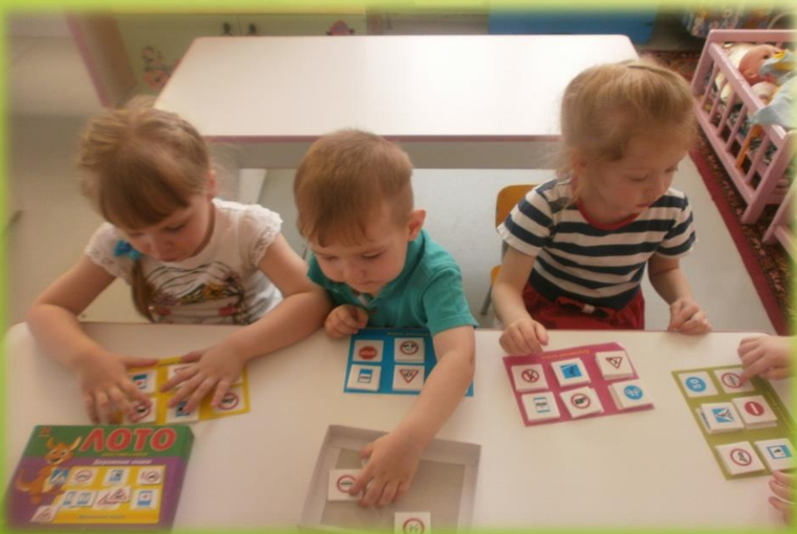
Настольная игра «Дорожный знаки»