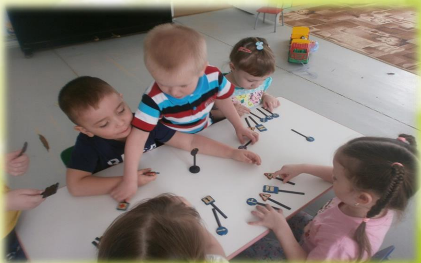
Беседа «Разные дорожные знаки»