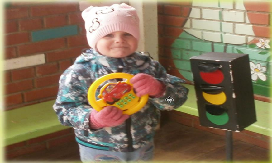
Подвижная игра «Автомобиль на дороге»