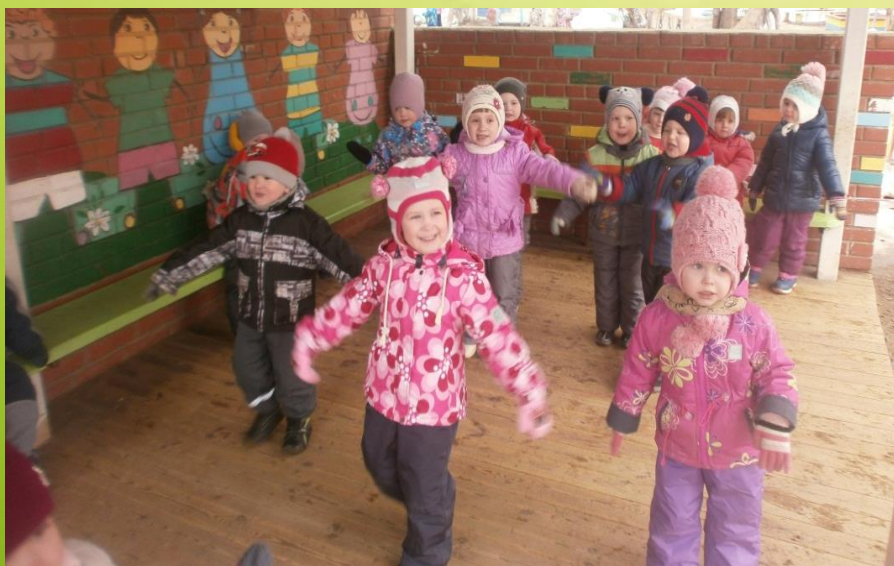
Подвижная игра «Мы пешеходы»