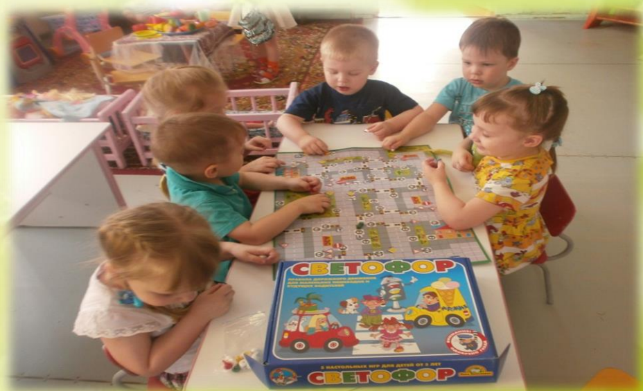
Настольная игра «В гостях у светофора»