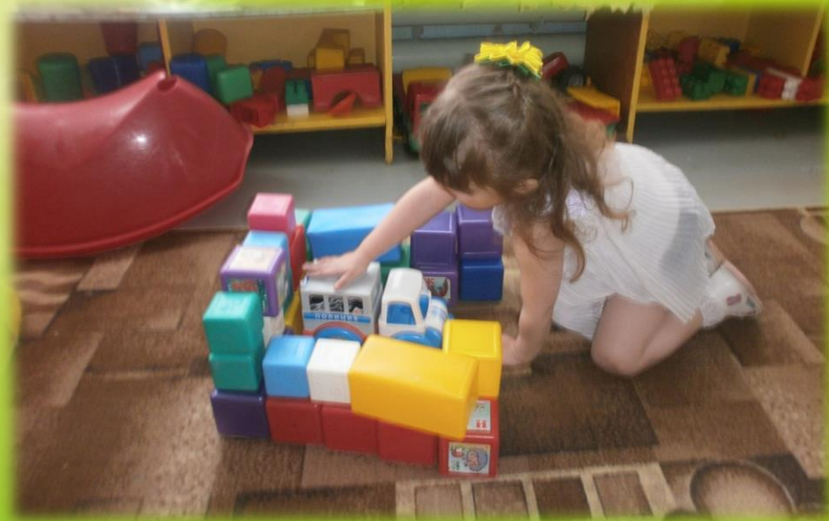
Строительная игра «Гаражные боксы»