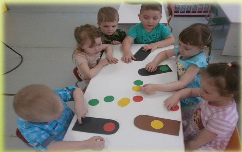
Настольная игра «Красный, желтый, зеленый»