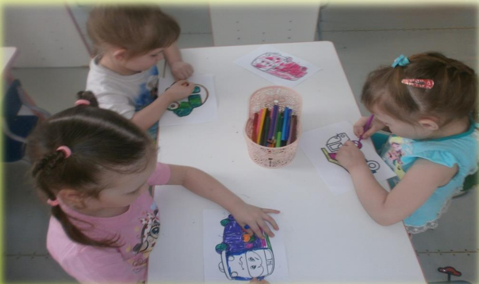
ООД Рисование. «Такие разные машины»