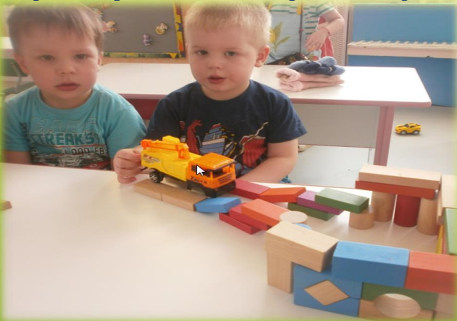
Строительная игра «Транспортный мост»