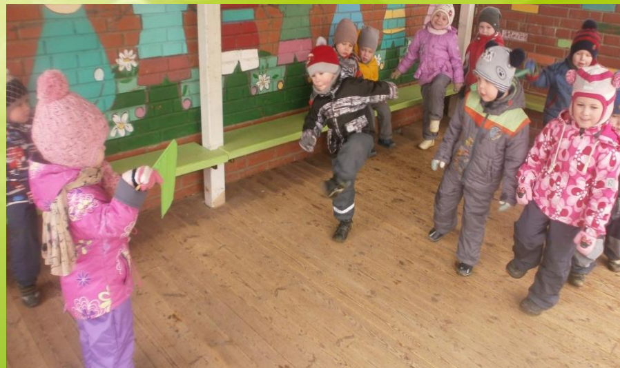
Подвижная игра «Сигналы светофора»