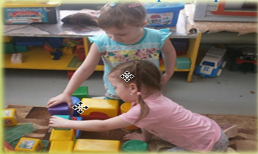
Игры со строительным материалом «Гараж»