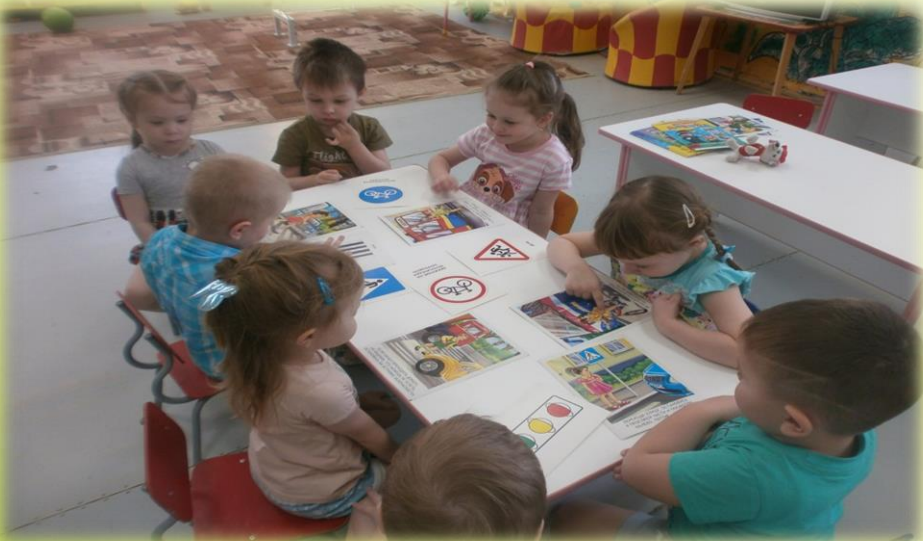
Беседа «Опасные ситуации»