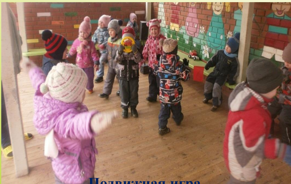
Подвижная игра «Воробушки и автомобиль»