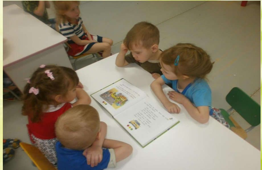
Чтение художественной литературой