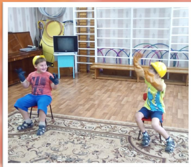
Игра: «Кто быстрее переоденется в спецодежду металлурга»