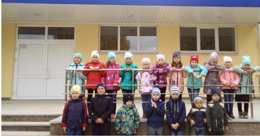
Средняя школа № 1