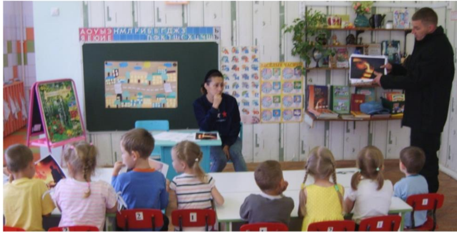
Рассказ Ткурова А.Н. о профессии металлурга