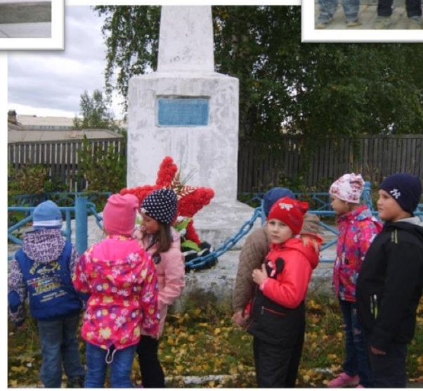
Памятник Щербакову Я. Н. на улице, названной в его честь