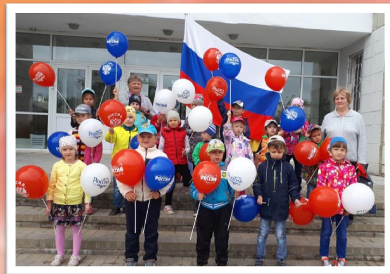
День Российского флага