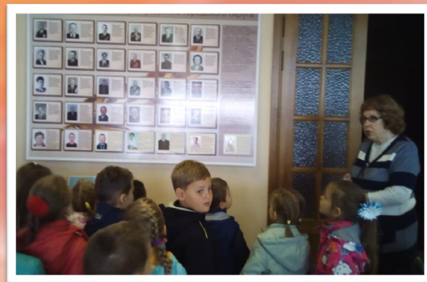
«Почетные люди нашего города»