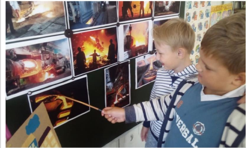
Рассматривание иллюстраций «Люди огненной профессии».