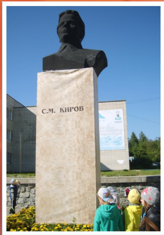
Знакомство с памятником С.М. Кирова, в честь которого назван наш город