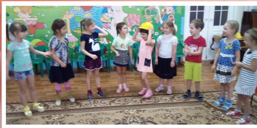
Игра: «Передай каску»