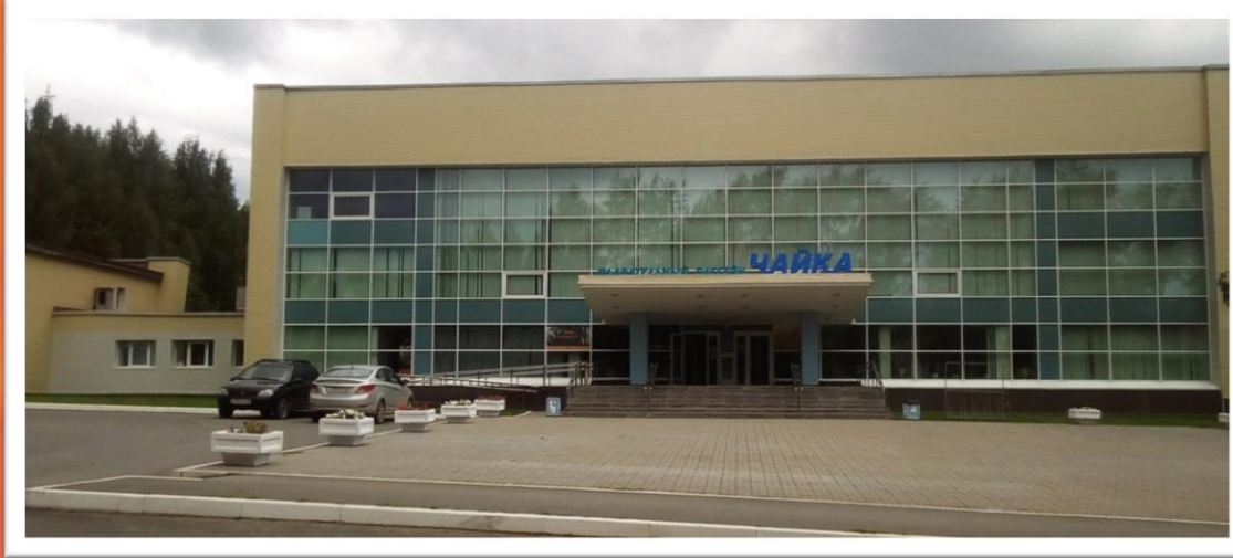
улица Калинина «Бассейн «Чайка»»