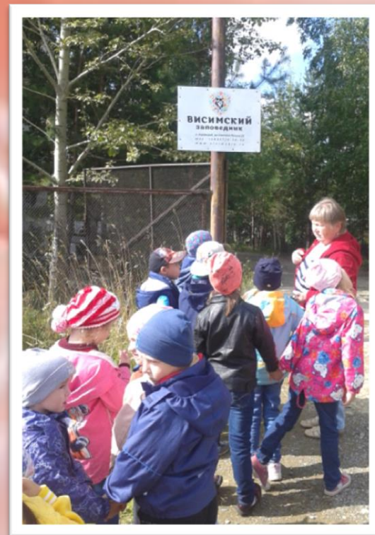
Висимский государственный природный биосферный заповедник.