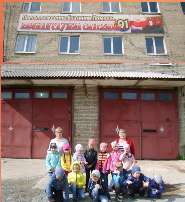
13 ОФПС МЧС России 258 ПЧ г. Кировграда.