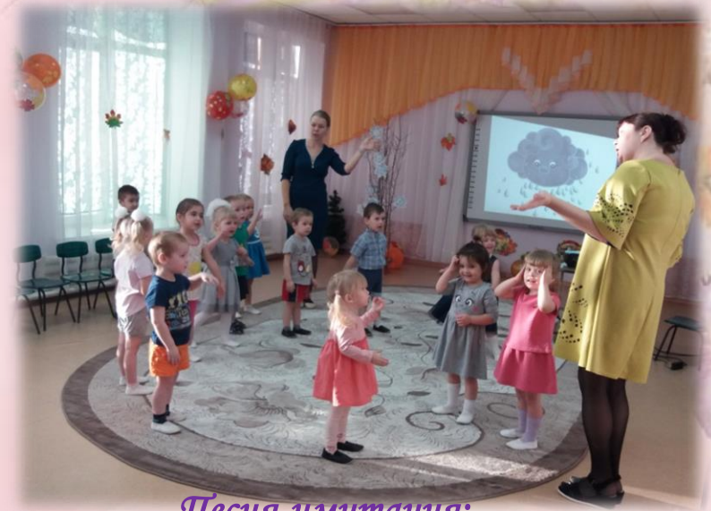
Песня-имитация: «Виноватая тучка»