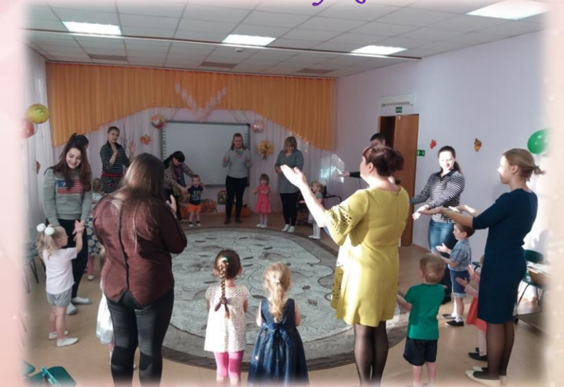
Танцевальная композиция: «У тебя, у меня»