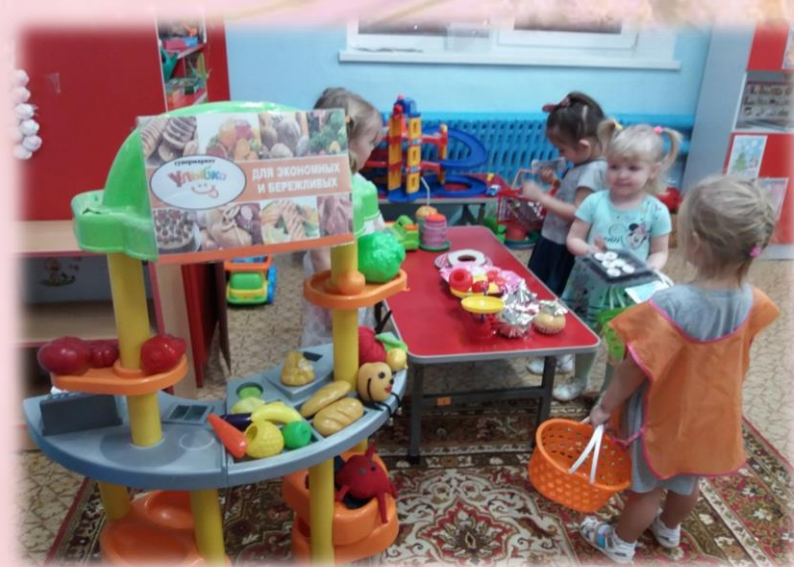
«Маме помогу, в магазин схожу»