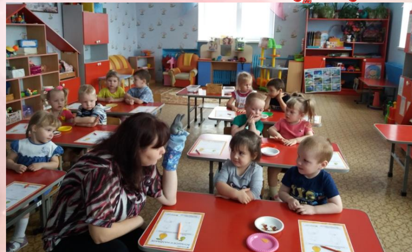
Дидактическая игра «Один - много»