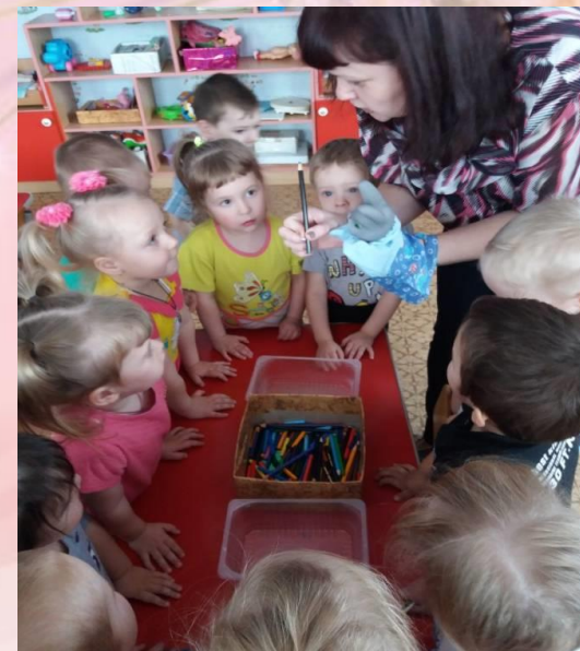
Игровое упражнение «Длинный - короткий»