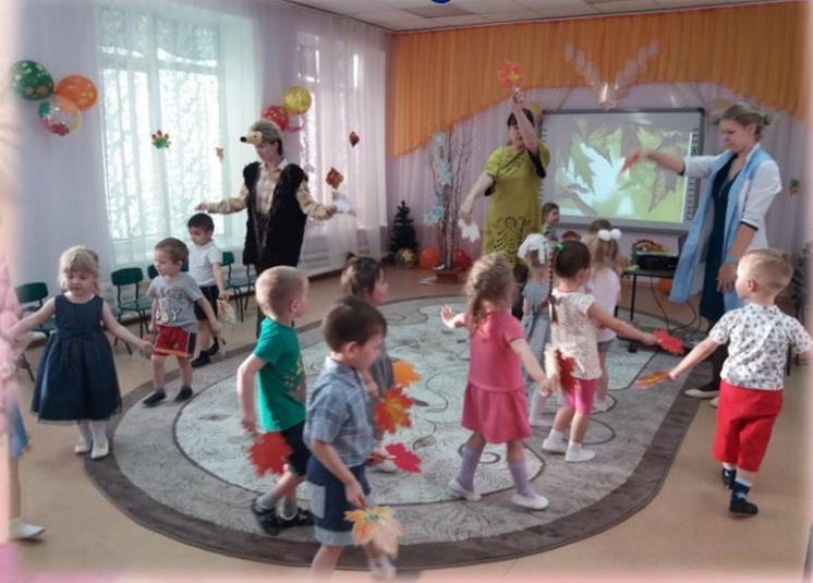
Танцевальная композиция «Полет на листочках в осенний лес»