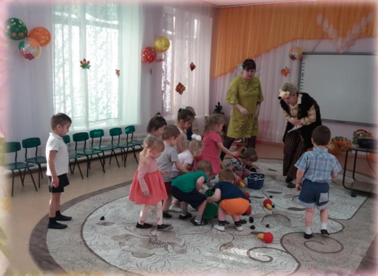
Музыкальная игра «Грибочки и шишки»