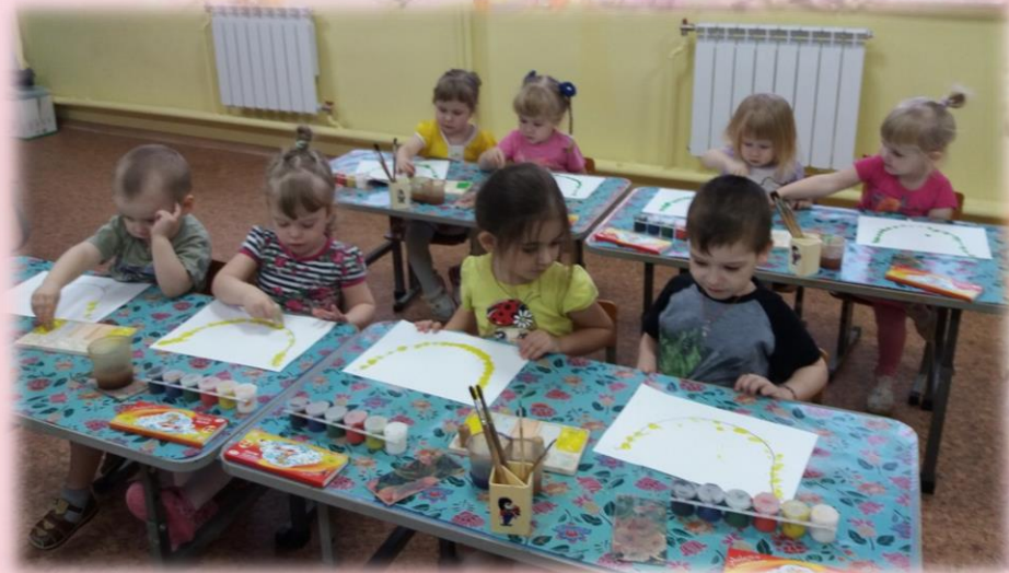
Рисование «Бусы для мамочки»