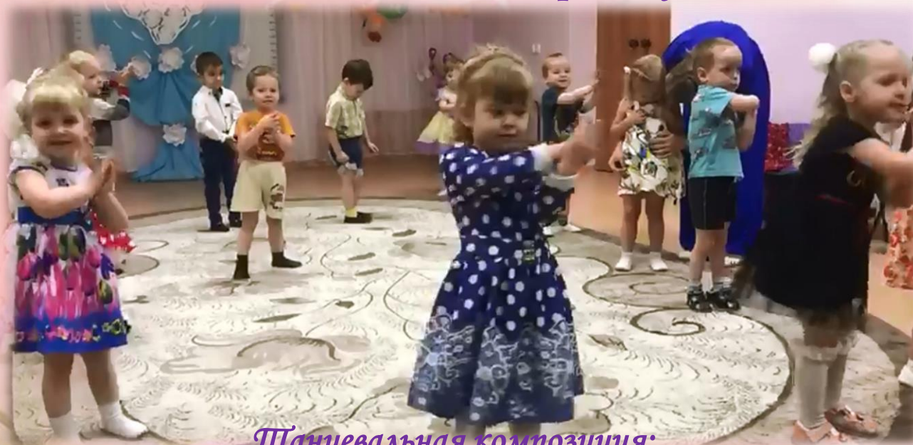
Танцевальная композиция: «Зайчики для мамочки»