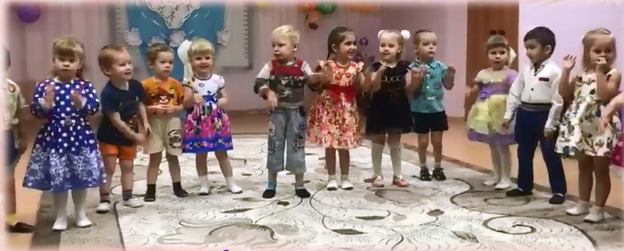
Чтение стихов про маму