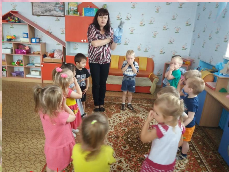
Физ. Минутка «Дружная семья»