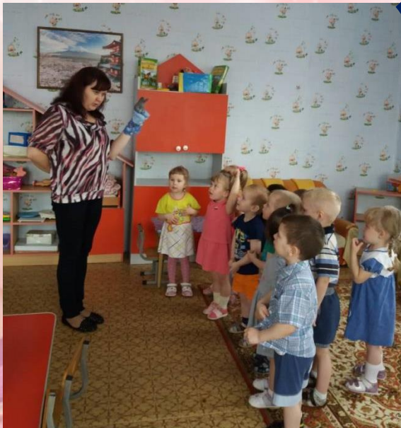
Сюрпризный момент «Зайка заблудился»