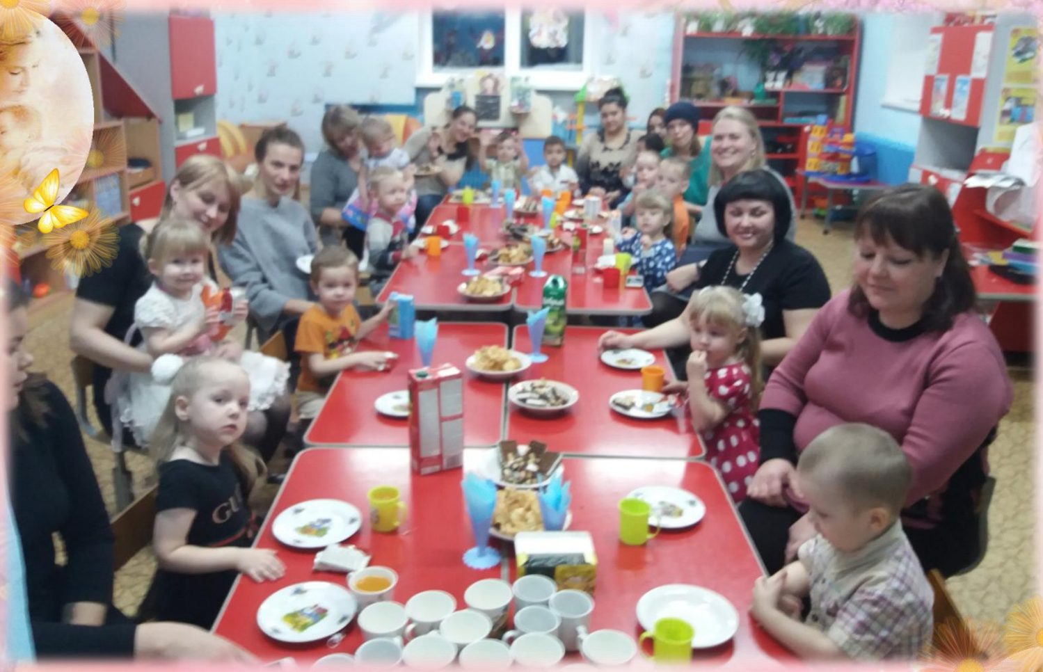
Совместное чаепитие с мамами