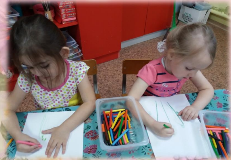
Рисование «Букет цветов»