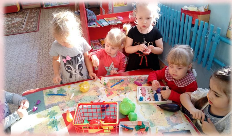
Лепка «Угощение для мамы»