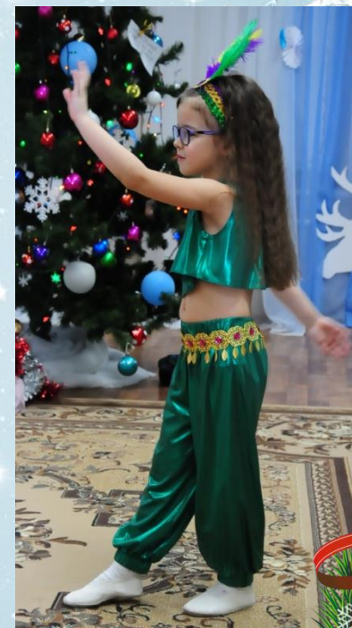
Танец восточных красавиц