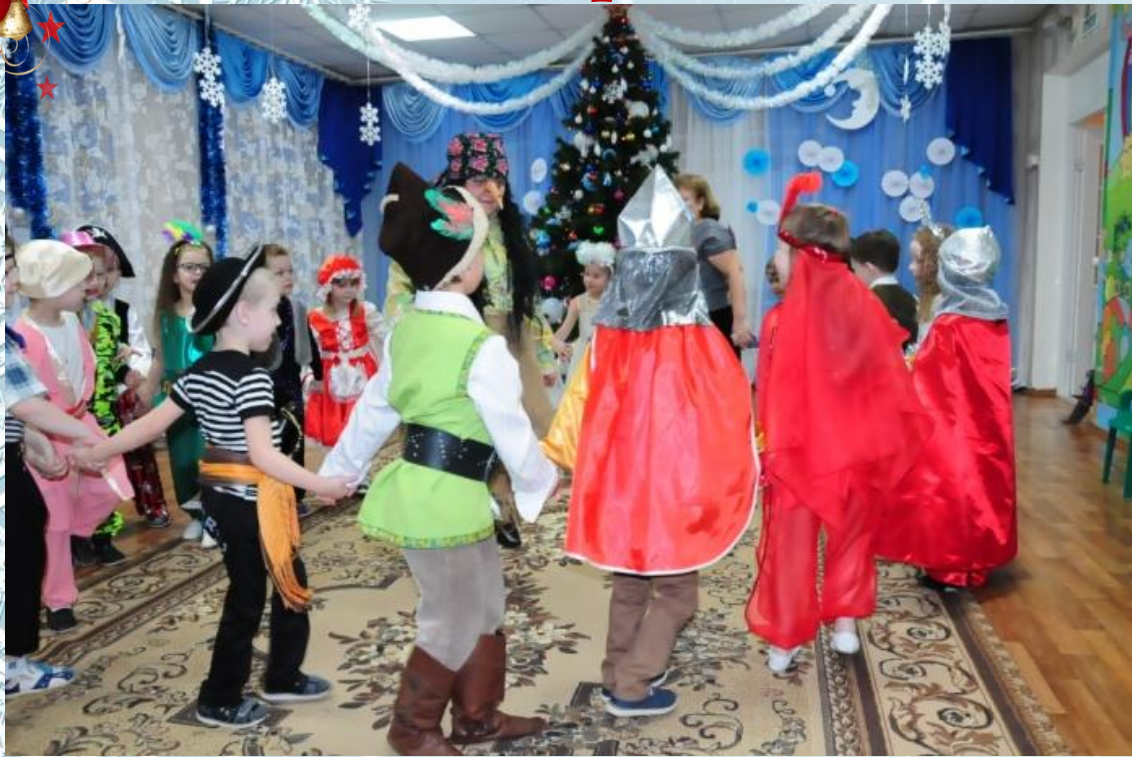
Песня-игра «Мы повесим шарик»

Песни спеть мы вам хотим, Ждем оваций между прочим, — За их исполнение, И для настроения!