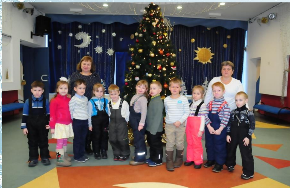
Хоровод вокруг елочки «В лесу родилась елочка»