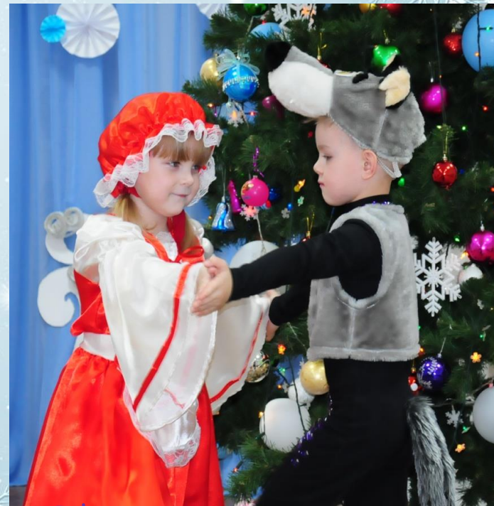
Танец красной шапочки и волка

Как танцуем мы красиво, Улыбаемся счастливо. Наши танцы хороши, Мы танцуем от души.