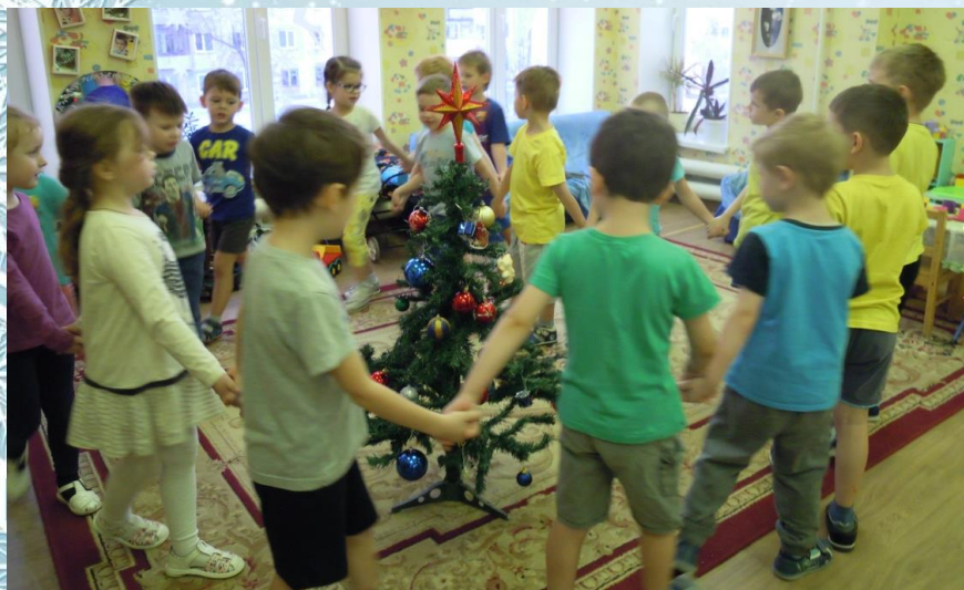
Хоровод вокруг елки «В лесу родилась елочка...»