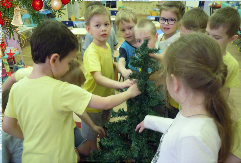
Дед Мороз прислал нам елку