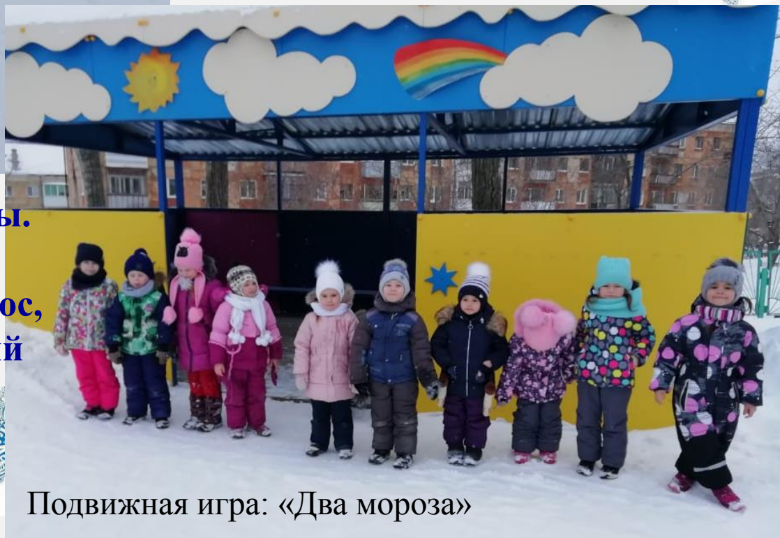
Подвижная игра: «Два мороза»

Встретились морозы братцы. В пору зимнюю резвятся. Старший брат был синий нос, Младший брат был красный нос. Братья по лесу гуляли, Ветер в поле разгоняли.