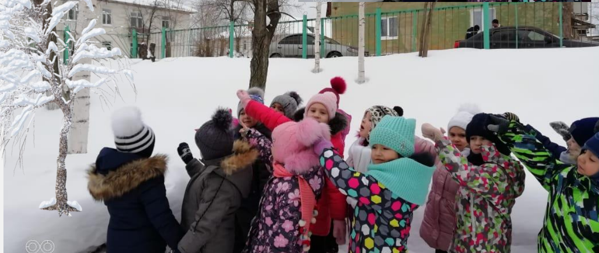
Наблюдение за березой