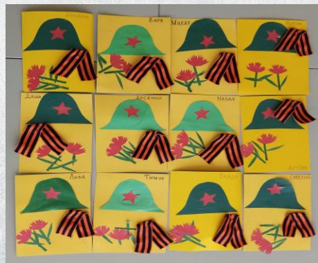
Аппликация «Открытка для ветерана»

В небе праздничный салют, фейерверки там и тут. Поздравляет вся страна славных ветеранов. А цветущая весна дарит им тюльпаны.