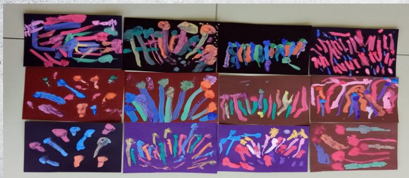
Рисование «Праздничный салют»