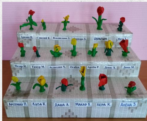
Лепка «Цветы для ветерана»