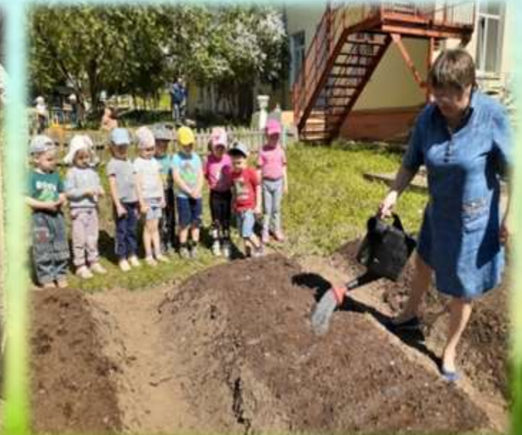
Полив после посадки овощей