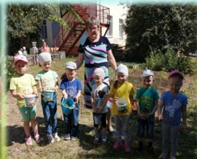
«Огород у нас неплох, только много сорняков» Прополка и рыхление лука