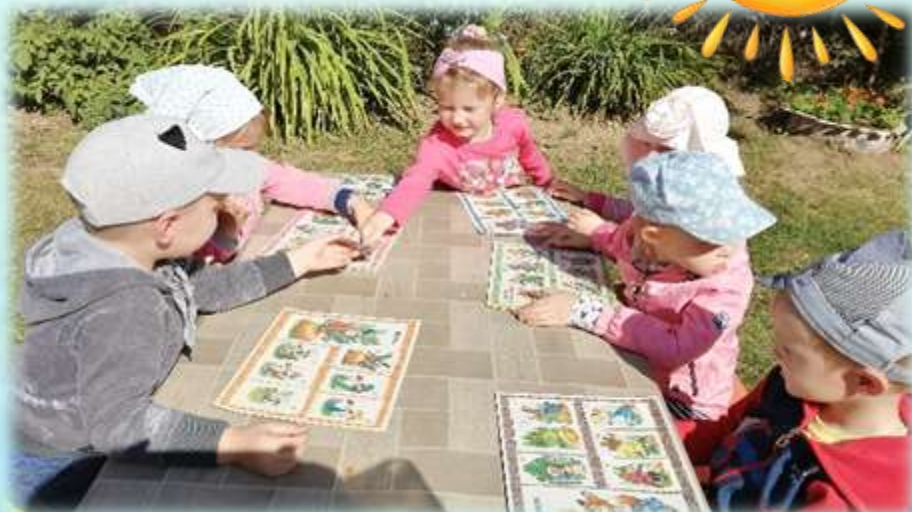
Игра -лото «Собери сказку»