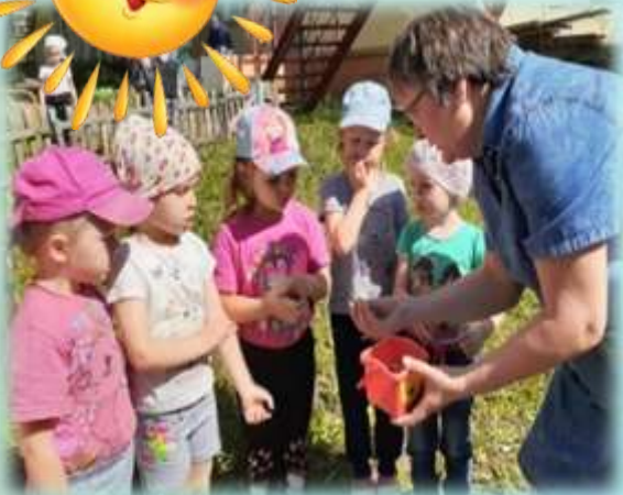
Рассматривание семян лука