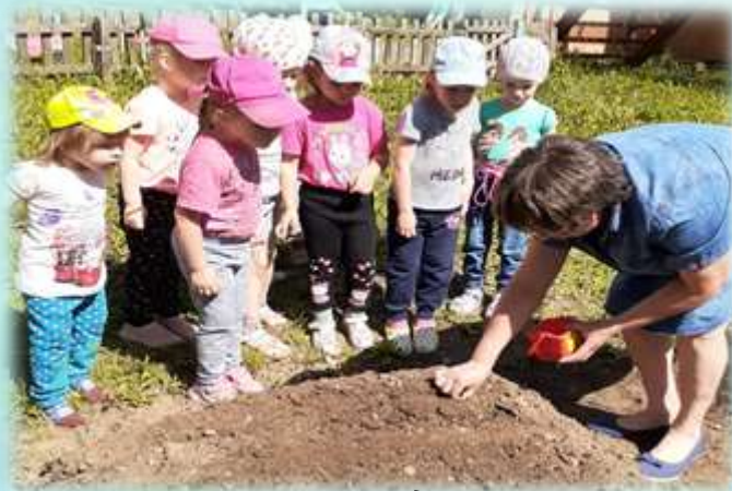
Показ посадки лук