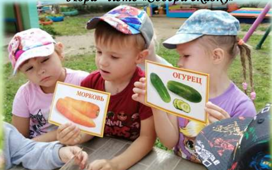
Игра «Где растёт?»