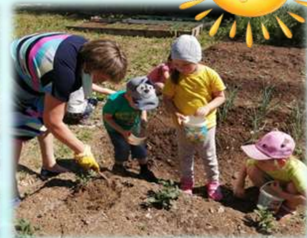
Наблюдение за ростом картофеля