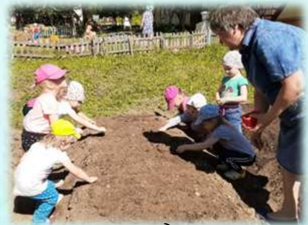
Девочки сажают лук