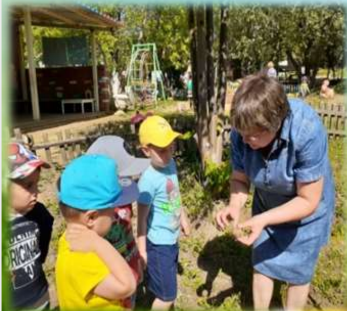
Рассматривание семян картофеля