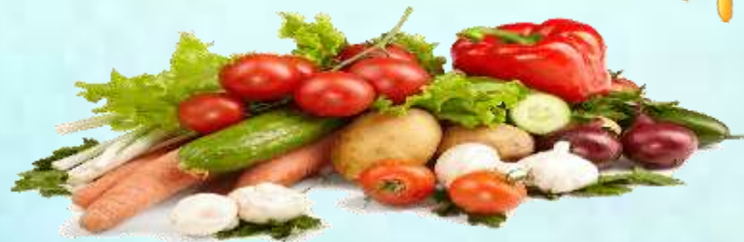
Раскрашивание раскрасок по теме «Овощи»