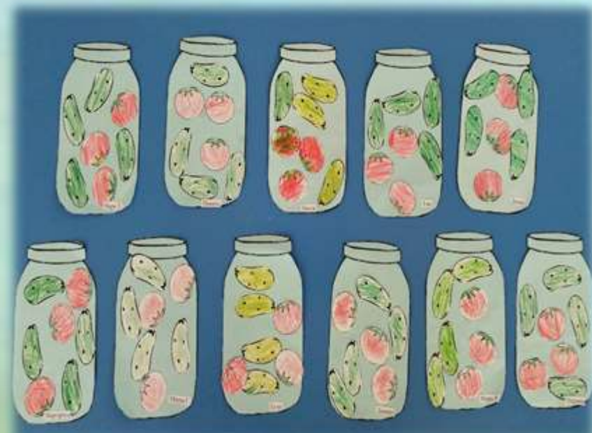
Аппликация «Заготовим овощи на зиму»