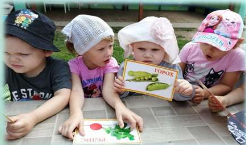
Игра «Вершки и корешки»