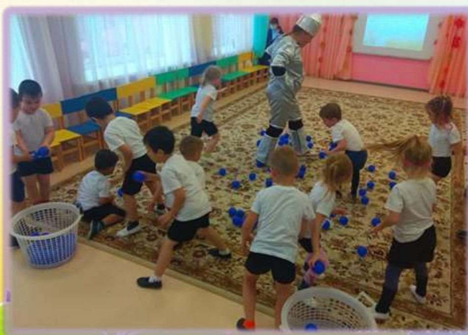
Игра «Собери капельки»