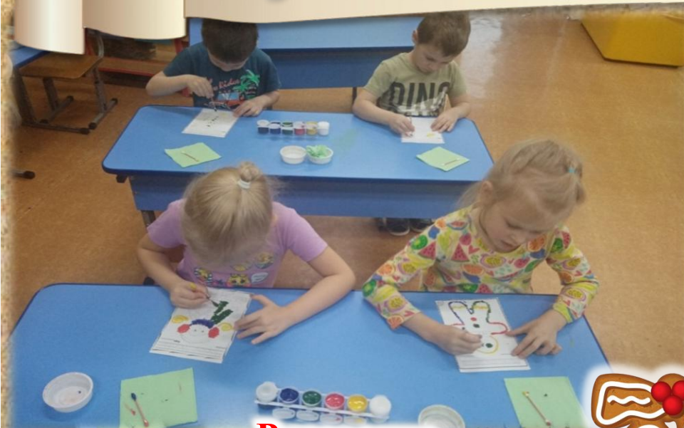
Рисование «Пряничные человечки»