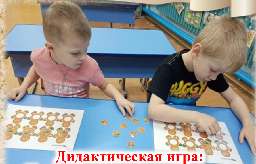
Дидактическая игра: «Подбери заплатку пряничному человечку»