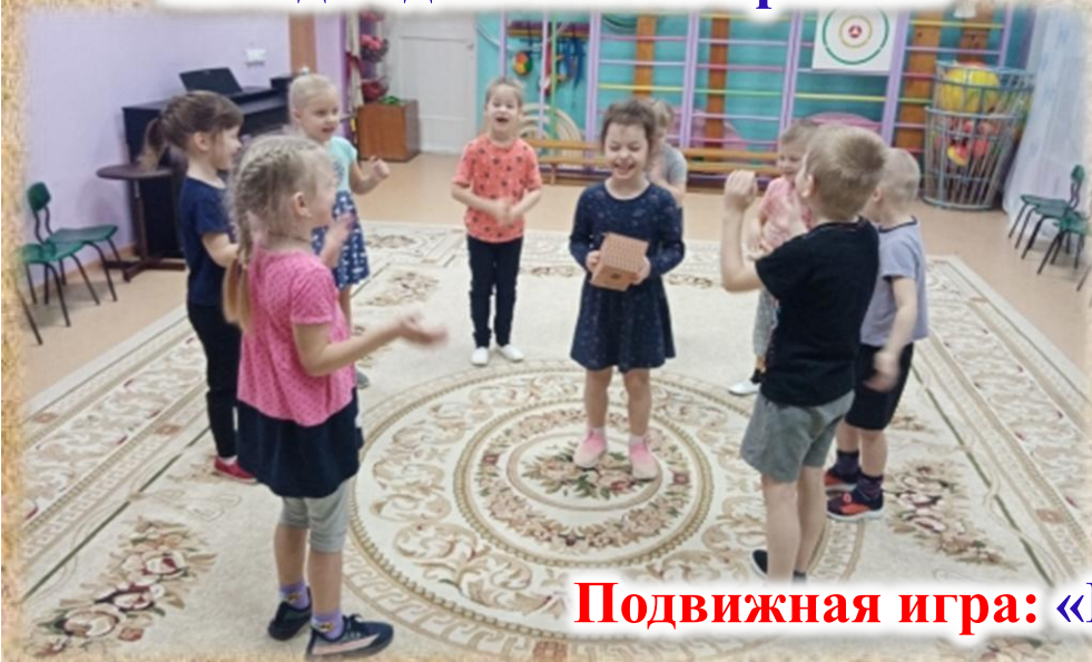
Подвижная игра: «Передай пряник»