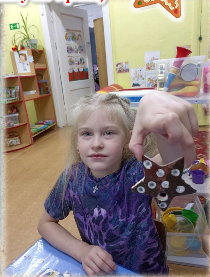
Коллективная работа «В зелени колючей спряталась рождественская сказка» старшая группа «ЛУЧИКИ» г. Кировград, Артпоощерская