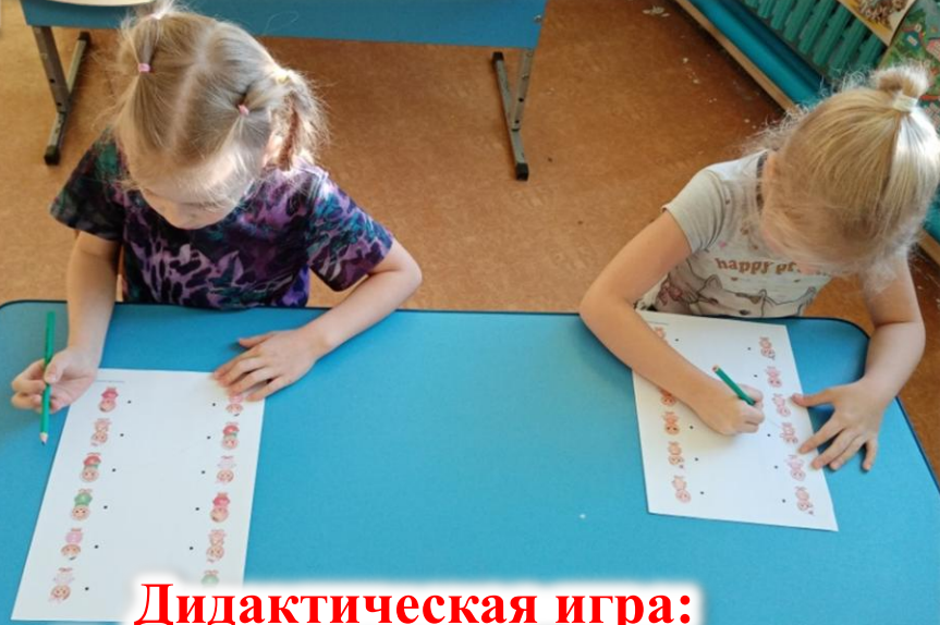
Дидактическая игра: «Найди одинаковый пряник»