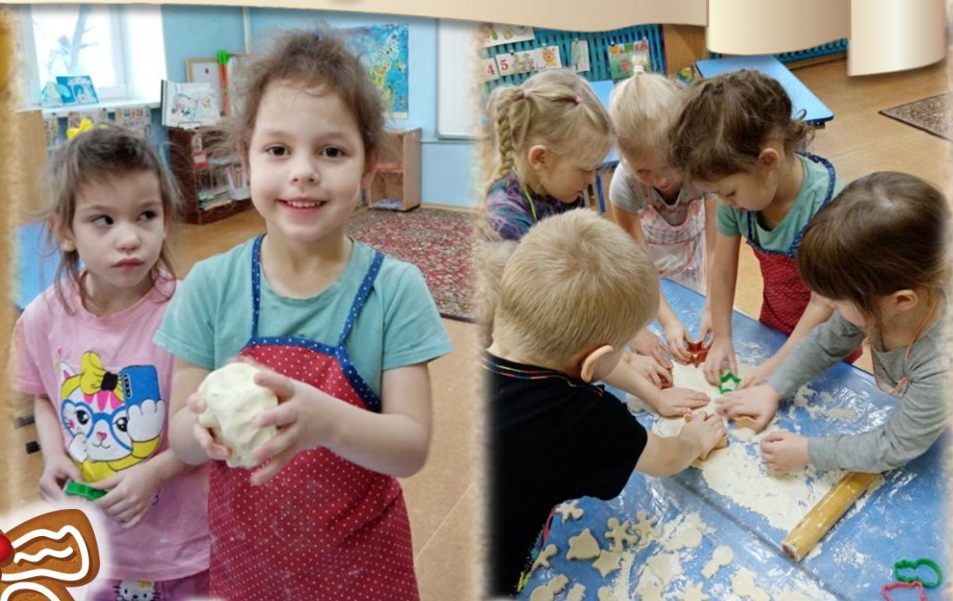
Лепка из солёного теста: «Пряничные фигурки»